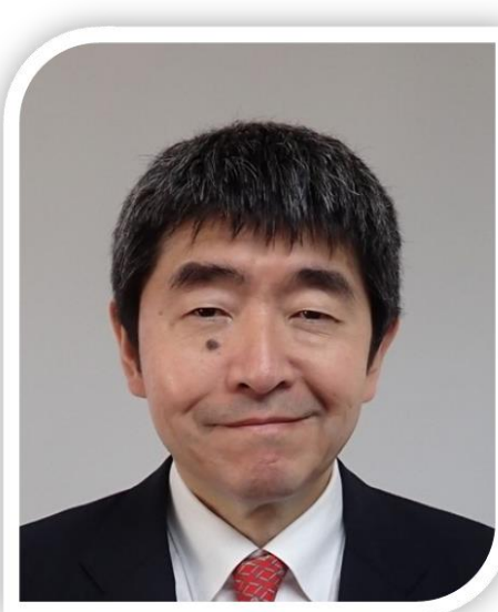
SANO Taketoshi Embajador del Japón en El Salvador

Es importante destacar que gracias al aporte de todos los participantes mencionados se obtuvo un total de US$472,808.79, siendo el aporte de Japón un total de US$264,475.00.