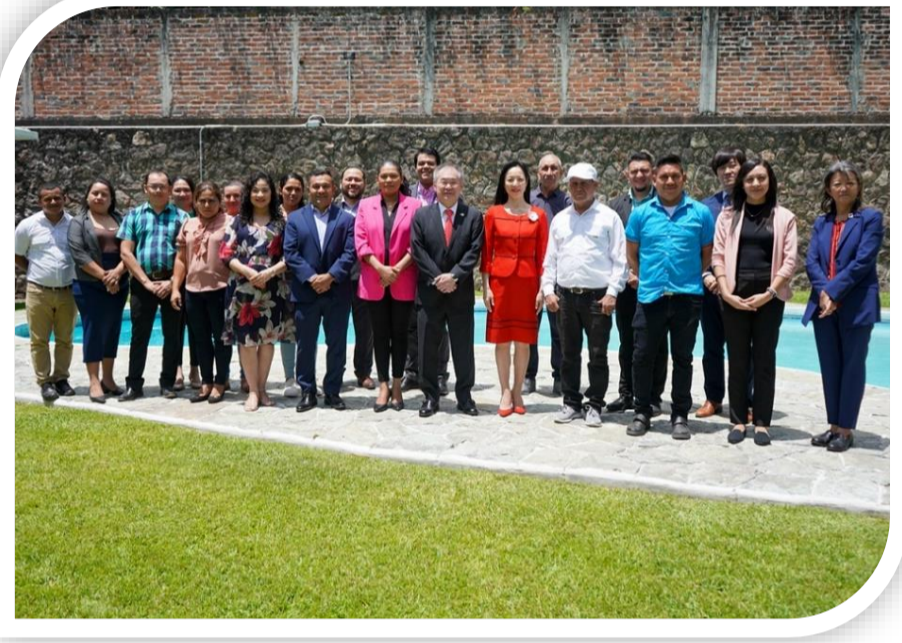
FIRMA DE CONVENIO DE PROYECTO DE CONSTRUCCIÓN DE LA INFRAESTRUCTURA DE LA UNIDAD COMUNITARIA DE SALUD FAMILIAR EN CANTÓN SAN DIEGO

Actualmente la Unidad Comunitaria de Salud Familiar del cantón San Diego ha estado funcionando bajo arrendamiento en una casa particular pequeña donde se han improvisado ambientes, con espacios limitados o compartidos, sin la privacidad necesaria que requieren los pacientes, el hacinamiento, la adquisición de enfermedades nosocomiales.