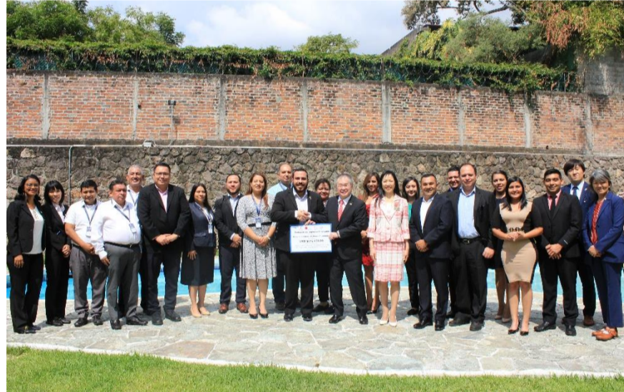
FIRMA DE CONVENIO DE CONSTRUCCION DE CENTRO DE DIALISIS DEL HOSPITAL NACIONAL DE NUEVA GUADALUPE

Actualmente en la zona oriental del país, los pacientes con Enfermedad Renal Crónica son atendidos en el Hospital Regional San Juan de Dios de San Miguel y el Hospital San Pedro de Usulután, pero en los últimos años debido a la creciente demanda de atención de pacientes la capacidad instalada es por hoy insuficiente; sobre todo en vista que esta enfermedad constituye un gasto catastrófico para el bolsillo de las familias que en su gran mayoría son de bajos recursos económicos.