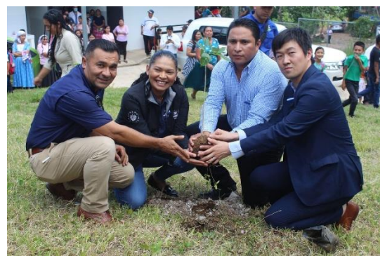
マキリシュワの植木