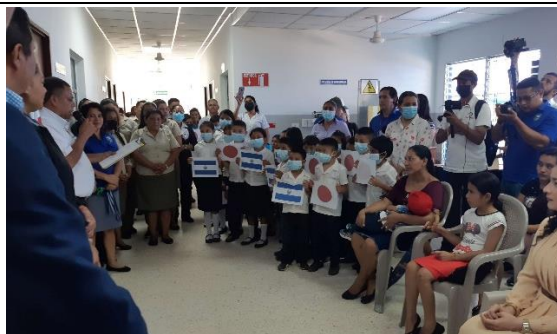
隣に建設されている小学校の子どもたち