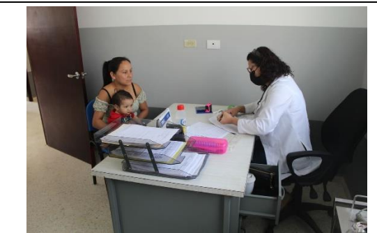
引き渡し式日に初診療を開始。母子健診。