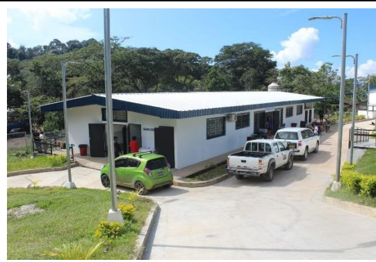
サン・シモン市バジェ・グランデ村診療所