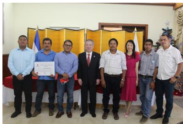
「タクバ市エル・チャグイテ村飲料水供給計画」