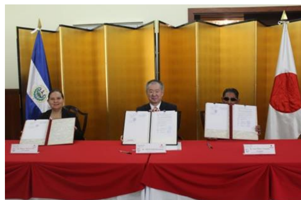
「サンティアゴ・ノヌアルコ市ラス・アニマス村 飲料水供給計画」G/C 署名