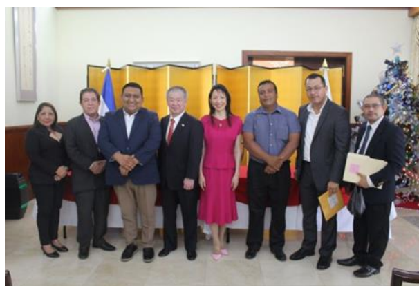
「イサルコ市ラス・イゲラス村飲料水供給計画」 集合写真